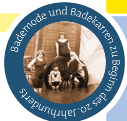
Bademode und Badekarren zu Beginn des 20. Jahrhunderts